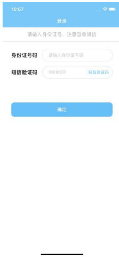
图 2.1 APP 登录