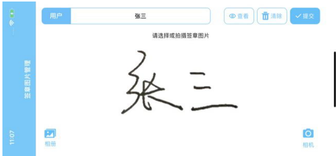
图 2.2 签章页面